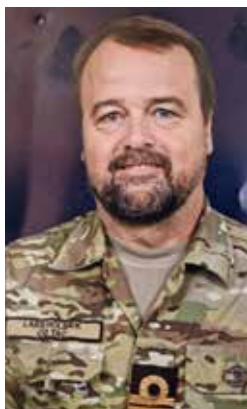
Af Lars Holbæk