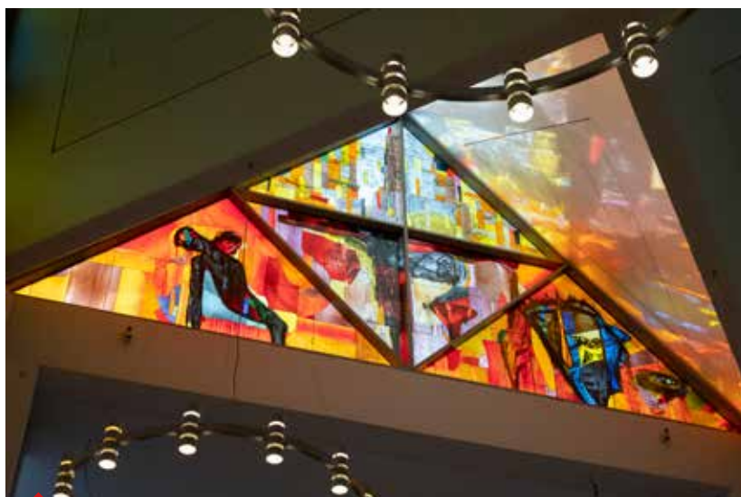
Korsfæstelse og opstandelse

På ruden er døden afbildet frygtelig virkelig. Til venstre ses Maria med sin døde søn i armene – pieta-motivet. Til højre ses både Jesus på korset og et stort sårmerket ansigt. Men yderst til højre, er tornekrone forvandlet til en fuglerede med æg. En forudgriben af opstandelsen, som fremstilles øverst, over korset som farve og lys.