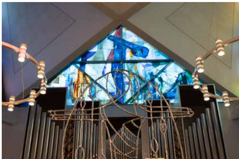
Abraham og Isak