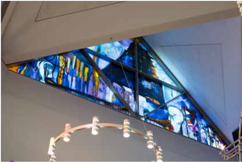
Kain og Abel